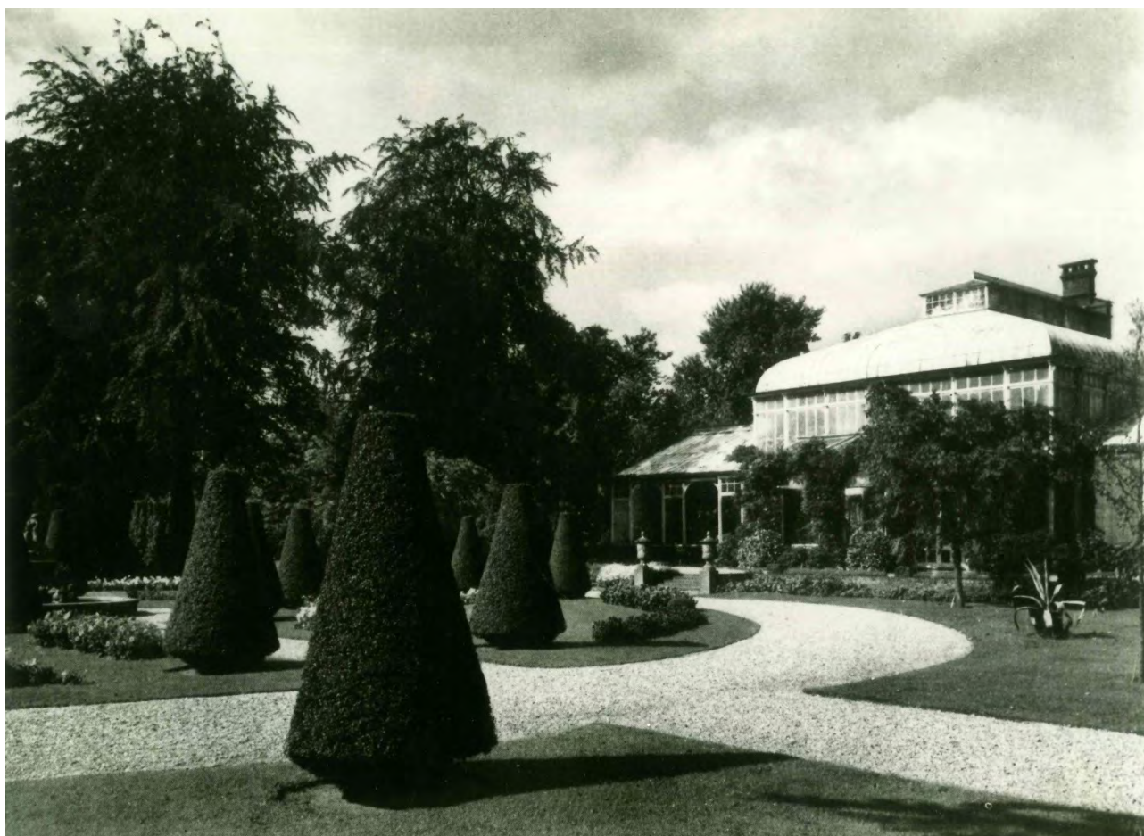
Het Cantonspark te Baarn op een foto uit ca. 1960. Stichting In Arcadië werkte aan een historisch onderzoek en het restauratieplan.