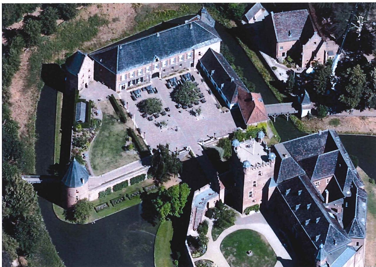
Het uitgevoerde ontwerp van het voorplein van kasteel Huis Bergh in 2018