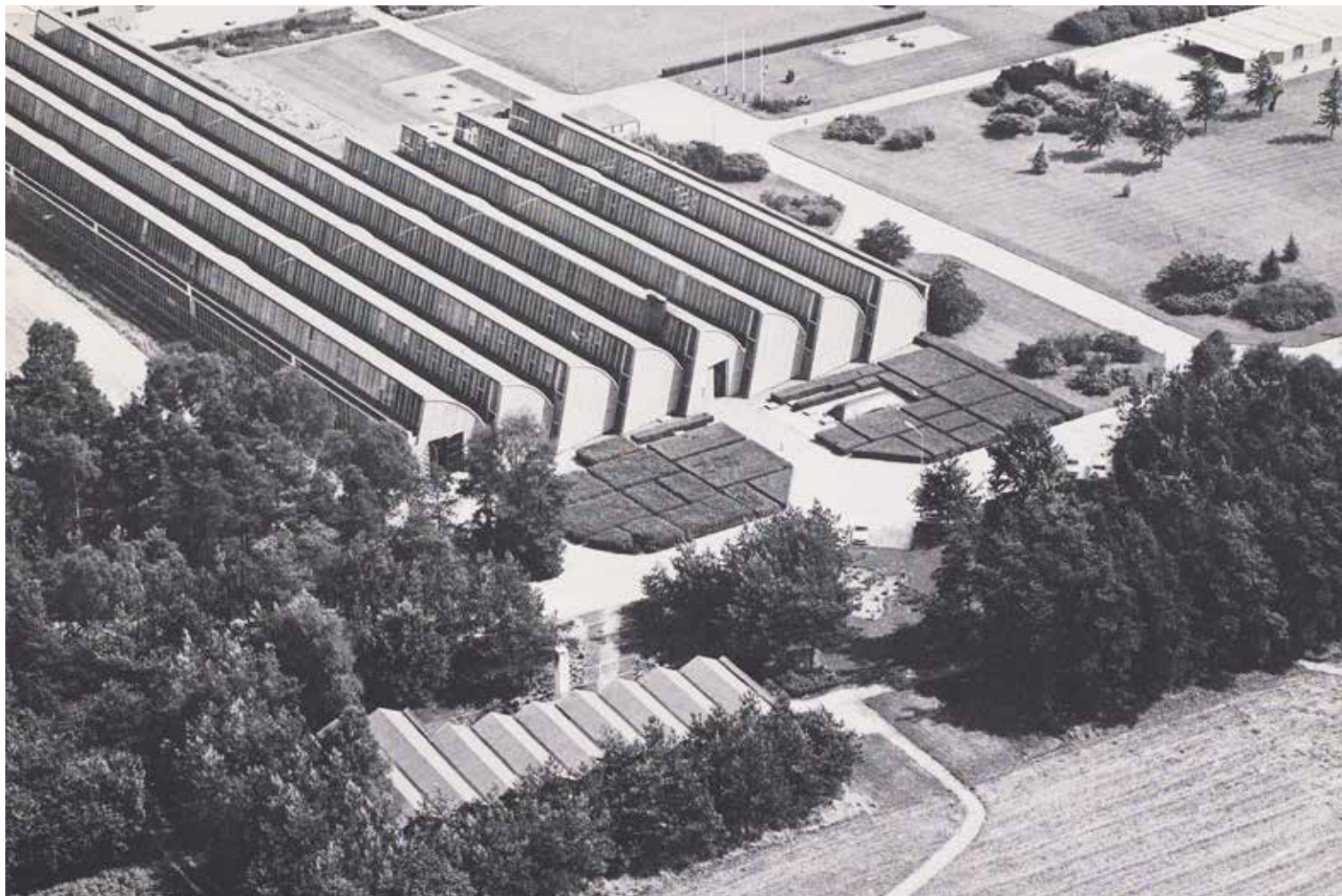
LUCHTFOTO VAN DE FABRIEK TE BERGEIJK, 1965-1973.