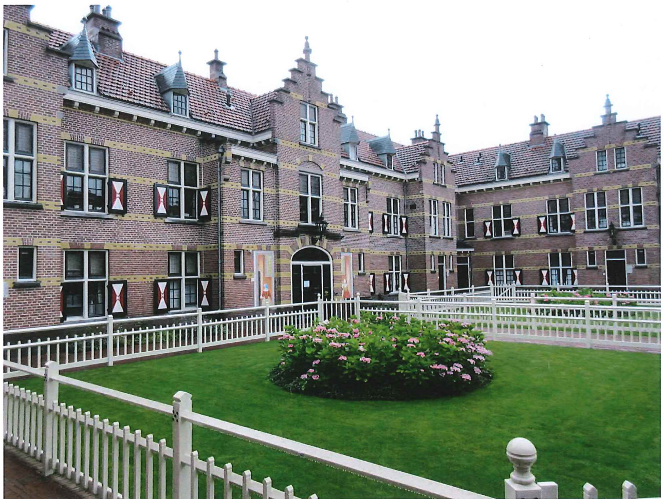
Herinrichting binnentuin Hofje van Hoogelande te Den Haag (2017)